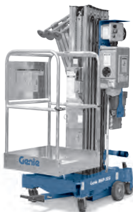
(1) Sólo en recambios